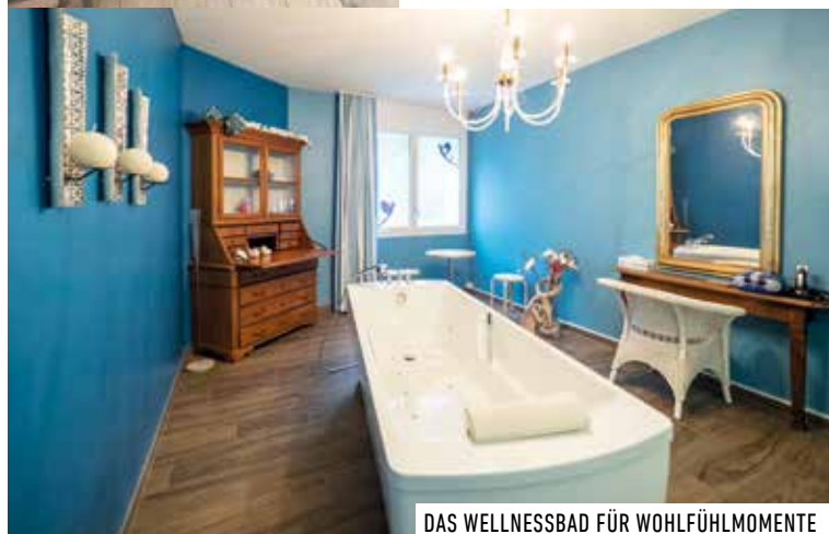
DAS WELLNESSBAD FÜR WOHLFÜHLMOMENTE