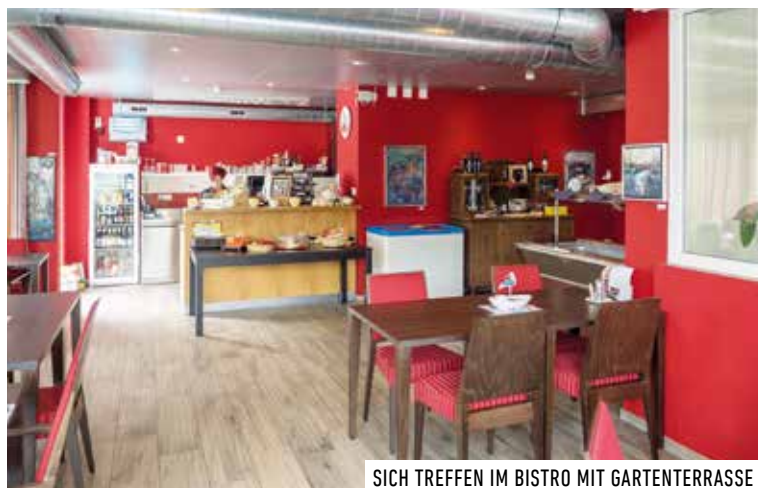
SICH TREFFEN IM BISTRO MIT GARTENTERRASSE