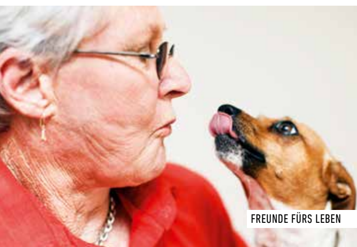
FREUNDE FÜRS LEBEN

Das Bistro im Erdgeschoss verwöhnt Gäste und Bewohner /-innen mit leckeren Kleinigkeiten und Mahlzeiten. Auch der Garten mit Kinderspielplatz und der Spazierweg zum Theiling (oder Braui-) Weiher laden ein zum Verweilen und Geniessen.