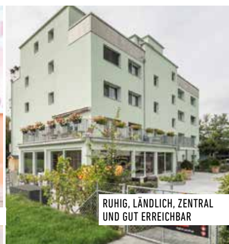
RUHIG, LÄNDLICH, ZENTRAL UND GUT ERREICHBAR