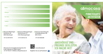
Die Almacasa-Punktekarte ermuntert zum Mit-Tun.

Den Alltag leben – Beziehungen neu gestalten: Genau darum geht es im Almacasa. Angehörige sind jederzeit willkommen – ob zum Geniessen oder zum Mitmachen. Sammeln Sie Punkte mit unserem Bonusprogramm – Ihre Beiträge sind uns etwas wert!