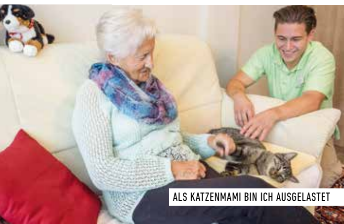
ALS KATZENMAMI BIN ICH AUSGELASTET

Almacasa bietet betreuenden Angehörigen oder allein lebenden Personen mit Bedarf an Pflege und Betreuung einen Ort der Entlastung. Angehörige und Nahestehende brauchen zwischendurch auch Zeit für sich, um bei Kräften zu bleiben. Eine Entlastung hilft, die Lebensqualität zu erhalten und soziale Beziehungen zu pflegen. Menschen mit Betreuungs- und Pflegebedarf können auf diese Weise so lange wie möglich in ihrer gewohnten Umgebung leben.