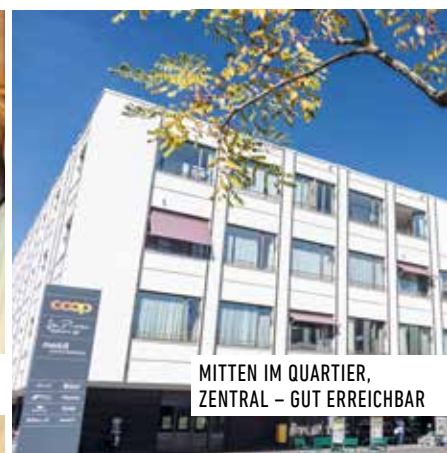
MITTEN IM QUARTIER, ZENTRAL – GUT ERREICHBAR