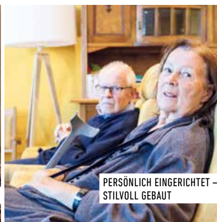
PERSÖNLICH EINGERICHTET – STILVOLL GEBAUT