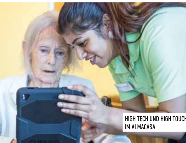
HIGH TECH UND HIGH TOUCH IM ALMACASA