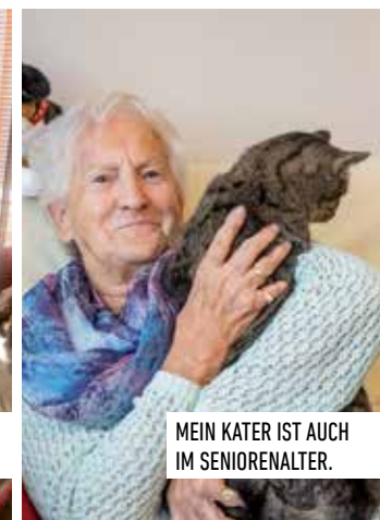
MEIN KATER IST AUCH IM SENIORENALTER.