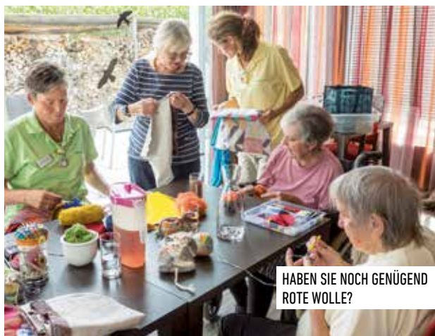
HABEN SIE NOCH GENÜGENG ROTE WOLLE?