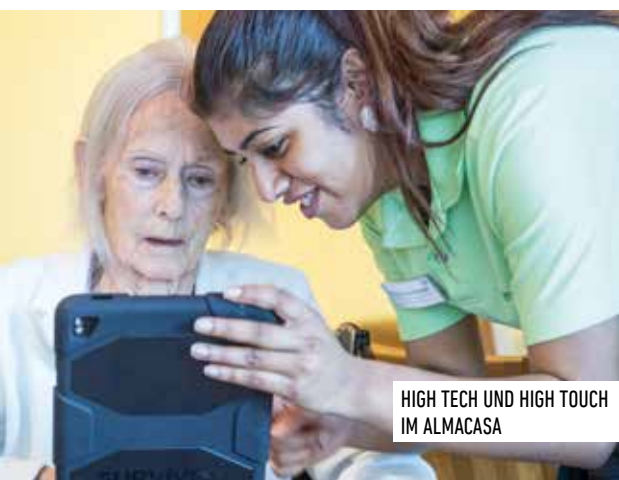
HIGH TECH UND HIGH TOUCH IM ALMACASA