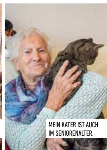
MEIN KATER IST AUCH IM SENIORENALTER.