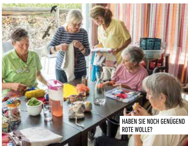
HABEN SIE NOCH GENÜGENG ROTE WOLLE?