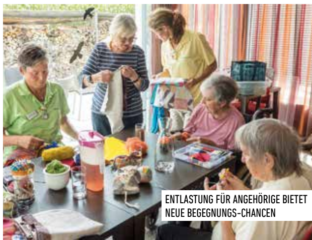
ENTLASTUNG FÜR ANGEHÖRIGE BIETET NEUE BEGEGNUNG-CHANCEN