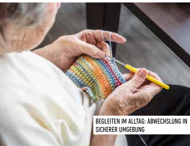
BEGLEITEN IM ALLTAG: ABWECHSLUNG IN SICHERER UMGEBUNG