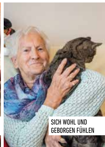
SICH WOHL UND GEBORGEN FÜHLEN