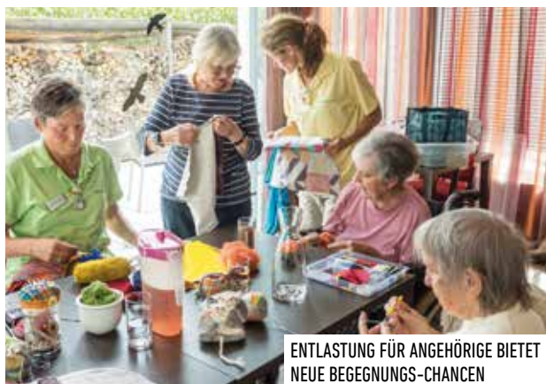
ENTLASTUNG FÜR ANGEHÖRIGE BIETET NEUE BEGEGNUNG-CHANCEN