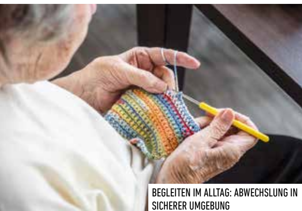
BEGLEITEN IM ALLTAG: ABWECHSLUNG IN SICHERER UMGEBUNG