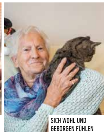
SICH WOHL UND GEBORGEN FÜHLEN