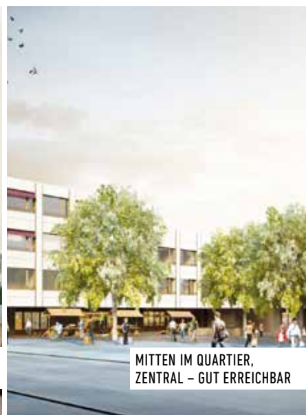
MITTEN IM QUARTIER, ZENTRAL – GUT ERREICHBAR