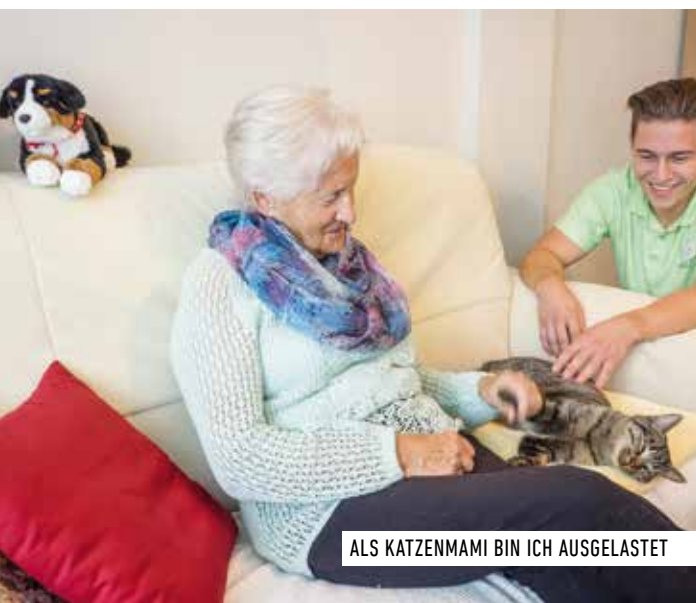
ALS KATZENMAMI BIN ICH AUSGELASTET

Komfort, Effizienz und Nachhaltigkeit prägen das von der Familienheim-Genossenschaft Zürich (FGZ) erstellte Gebäude nach Minergie-Standard. Dies ist der Standard der Zukunft und passt hervorragend zu den Grundsätzen und zum Leitbild von Almacasa.