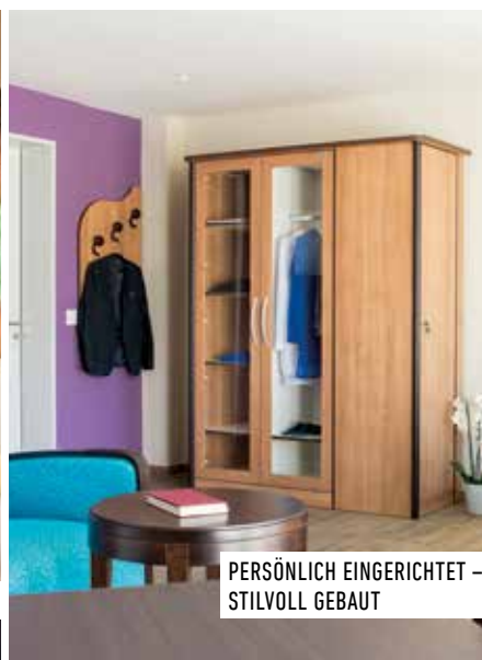
PERSÖNLICH EINGERICHTET – STILVOLL GEBAUT