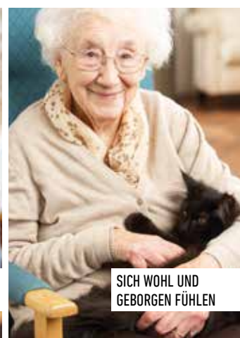
SICH WOHL UND GEBORGEN FÜHLEN